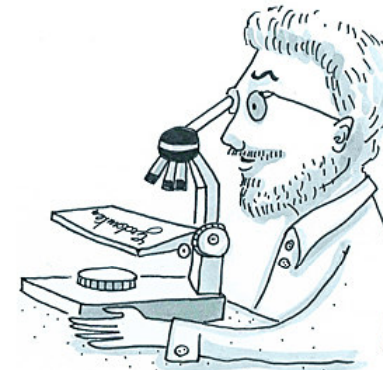
Der Wissenschaftler untersucht die eigenen Gedanken ganz genau...