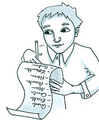
Das hilft... Durch Aufschreiben sehe ich klarer!

Aufschreiben ist ein sinnvoller erster Schritt - besonders wenn man das Problem in konkrete, präzise Worte fasst anstatt es vage oder oberflächlich zu beschreiben.