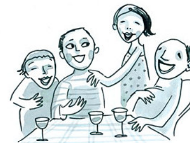
Einfach mal lachen und sich was trauen...

Also nicht passiv und schüchtern, sondern mutig auf andere zugehen, sich trauen, auch einmal Unsinn zu sagen. Diese Anweisungen funktionierten an sich schon ganz gut. Wer sich so verhielt, fühlte sich meist mit der Zeit irgendwie besser.