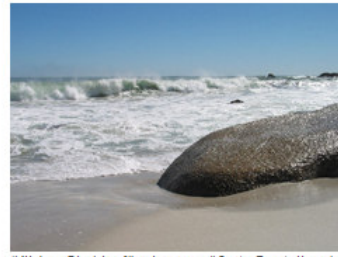
(Klicken Sie hier für eine vergrößerte Darstellung)